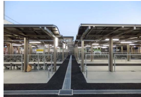
「南自転車等駐車場」