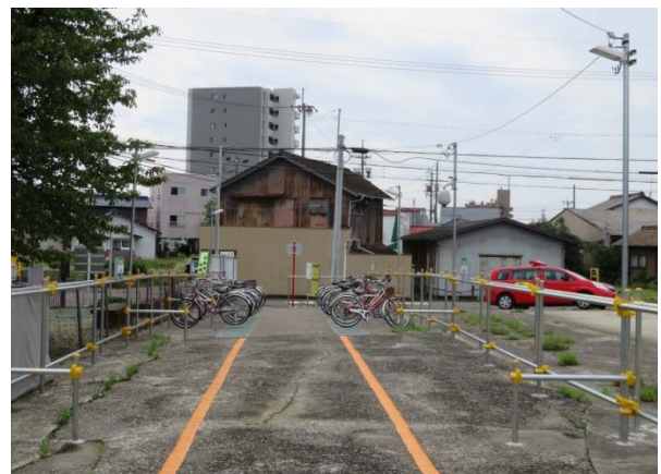
名鉄新清洲駅北第2自転車駐車場