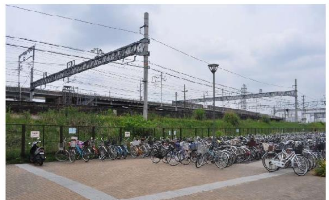
駅前広場の放置 (J R 枇杷島駅)