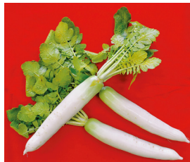
問 生涯学習課(南館1階)

定員 20名 参加費 無料 ところ 午前9時30分～11時30分 にしび創造センター 3階視聴覚室