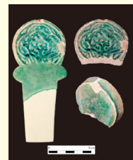
▲ヘレス市で発掘されたイスラム帝国時代の墓標