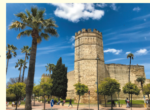
▲アルカサルの八角柱の櫓