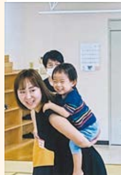
子どもたちと色々な遊びを楽しむ様子

同じ境遇を持つ人たちとの井戸端会議は、きつとりフレッシュに役立ちます。毎月第3水曜日の午前10時。場所は新川ふれあい防災センターです。ねこのこさんの猫の手借りてみませんか。