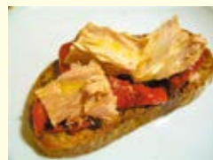
▲マグロのオリーブオイル漬けを乗せたトースト