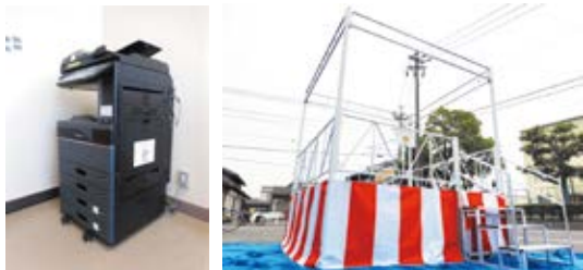
整備したコミュニティ備品