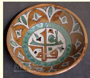
▲アラビア文字が描かれている食器

それらの食器には、アラビア文字や動物、植物等の絵が描かれていました。その絵には、マンガンで作られた黒色と、銅で作られた緑色が使われています。黒色には「力、緊縮と威厳」、緑色には「幸福」という意味が込められており、政治的、そして宗教的な象徴を表しています。ヘレス市立考古学博物館では、さまざまなイスラム帝国の食器が見学できます。