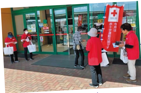
市赤十字奉仕団の方々

今年は、市赤十字奉仕団の皆さまとともに、市内のスーパー等3カ所で啓発活動を実施しました。