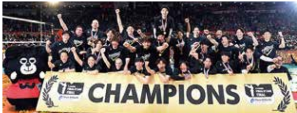
4/23(日) 2022-23 V.LEAGUE優勝

ウルフドッグス名古屋は、2022-23 V.LEAGUE ファイナル及び黒鷲旗ともに優勝し、今シーズン2冠を達成いたしました！地域の多くの方々からのご支援・ご声援をいただけたからこそこの優勝であり、最高のご報告ができることをうれしく思います。今シーズンもたくさんの応援をいただきありがとうございました。引き続き、清須市の皆さまにバレーボールを通じて元気と勇気をお届けし、皆さまに愛され応援していただけるチームを目指してまいります。エントリオにご来場いただき、応援よろしくお祈りします!!