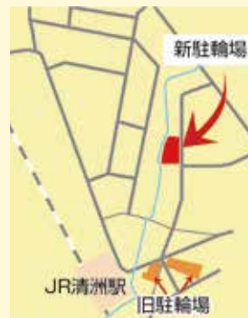
清洲駅自転車駐輪場位置図

7月1日(土)以降は、既設の無料駐輪場の利用ができなくなります。施設の閉鎖後1週間を超えて施設内に残っている自転車等は、放置自転車等として保管所に移動しますので注意してください。