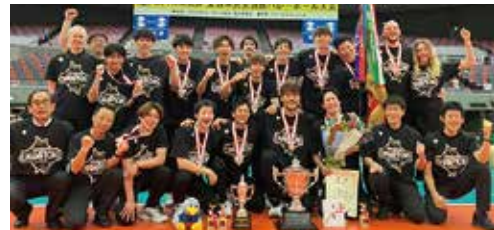
5/6(土) 黒鷲旗全日本男女選抜大会優勝