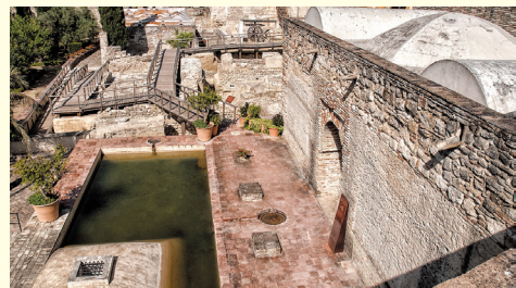
▲ロイヤル・パビリオンから眺められる池

Pabellón Real (=ロイヤル・パビリオン)は、Torre Octogonal (=八角形の櫓)の横にある城壁上に建てられた州総督のプライベートエリアでした。アーケードと石膏細工の装飾が施された柱廊を通り、八角のドーム型の屋根がある建物の中央に部屋がありました。中央の部屋の両側は、「Alfiz」に囲まれた雄大な馬蹄形のアーチがあり、その奥に寝室がありました。Alfizとは、アーチを構成する長方形のモールディングで構成される建築装飾品で、イスラム建築の特徴です。Pabellón Realの窓からは中庭の池や噴水が眺められます。イスラム建築では、水と植物が完全に調和することが重要でした。