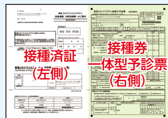
▲3回目予防接種済証+接種券一体型予診票