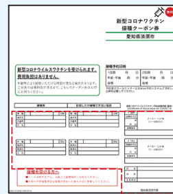
▲1・2回目クーポン券