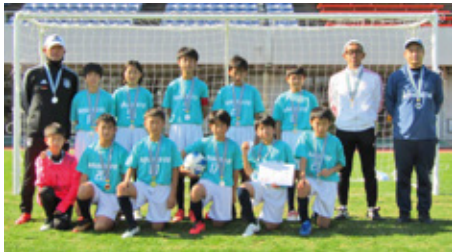
西枇杷島町サッカースポーツ少年団