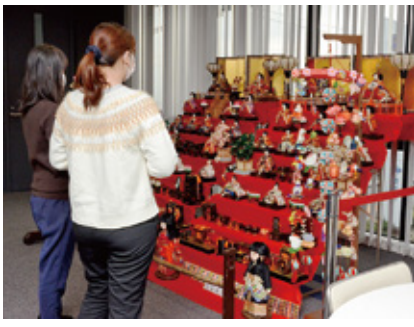
●清洲城芸能文化館②市役所北館2階子育て支援課前 産業課(南館3階)