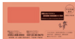
▲3回目接種封筒イメージ