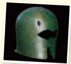
▲ヘレス市で発見された 古代ギリシアの兜

●不燃ごみ収集■丸の内、下本町、中本町、竹屋町、上本町、田中町(JRより南側)…毎月第2・4水曜日■朝日、伊勢町(JRより北側)、一場…毎月第2・4土曜日■田中町(JRより北側)、西田中・弁天…毎月第1・3土曜日■伊勢町(JRより南側)、西市場一～五丁目、永安寺、神明町、西市場住宅、廻間、西清洲、土田、土田住宅、上条、新清洲一～六丁目…毎月2・4水曜日