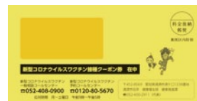
▲封筒イメージ(個別通知)

※令和3年度の個別通知発送後に16歳となる方には、誕生月の翌月始めに発送を予定しております。16歳になる方は誕生日の前日からコロナワクチン接種の対象者となりますが、発送よりもクーポン券を早く希望する方は、健康推進課(☎052-400-2911)にご相談ください。