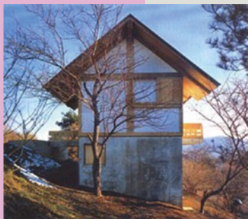
《不二の一文字堂》1980年