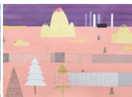
《あっちの世界こっちの世界》