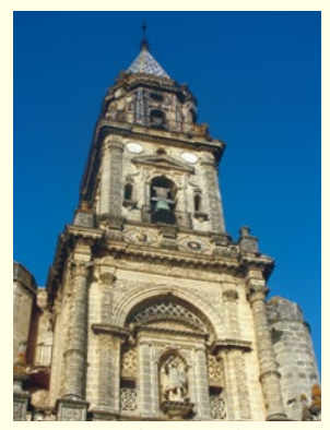
ヘレス市で最も高いサン・ミゲル教会の鐘楼

¡Buenas! ¿Todo bien? こんにちは! 元気ですか? 今回は重要文化財であるIglesia de San Miguel (=サン・ミゲル教会)とその教区について紹介したいと思います。 Iglesia de San Miguelは15世紀末から18世紀にかけて、ゴシック式、ルネサンス式とバロック式で建てられた教会です。ヘレス市の一番美しい教会とされていて、鐘楼は街の中で一番高い場所です。1931年にはスペイン重要文化財に登録されました。 Iglesia de San MiguelはParroquia de San Miguelという教区に建てられ、その教区を中心となっていきました。15世紀から、教区はどんどん広がっていき、人口も増え、ヘレス市一番の人口密集地域になりました。 16世紀から18世紀にかけて建てられたCapilla de las Angustias(アングスティアスの礼拝堂)や、18世紀に建てられたPalacio de Villapanésという宮殿など、Parroquia de San Miguel教区内で、さまざまな歴史的建築物が見学できます。また、フラメンコはこちらの教区で生まれたといわれています。 ヘレス市教育委員会と歴史文化財課が市内の中高生向けに企画している行事の一つに、Parroquia de San Miguel教区への訪問があります。野外学習として行われ、生徒たちがPlaza de las Angustias広場から出発し、Capilla de las AngustiasとIglesia de San Miguelを見学し、自分の街の歴史を身近に感じることができます。 清須市の一番高い場所はどこだと思いますか?