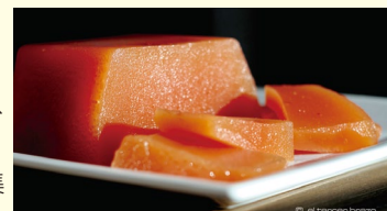
「Tosantos」に食べるマルメロゼリー

ヘレス市では、この日を「Tosantos」と呼んでいます。その日は昔からの習慣で、家族が集まり先祖の思い出を語りながら、旬な食べ物を一緒に食べます。スペインでは11月が日本と同