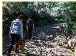
キノコ狩りイベントの参加者

スペインでは、秋になると、山へ出かけてキノコ狩りをする方がたくさんいらっしゃいます。ヘレス市にある[Los Alcornocales]自然公園は、100種類以上のキノコが生息しており、豊富な種類のキノコ狩りが楽しめます。「Champión」(=マッシュルーム)をはじめ、「Rebozuelo」(=アンズタケ)や「Niscaló」(=アカハツタケ)など、食べられる種類がありますが、テングタケ属の毒キノコの種類も多いので、採る時に気をつけなければなりません。