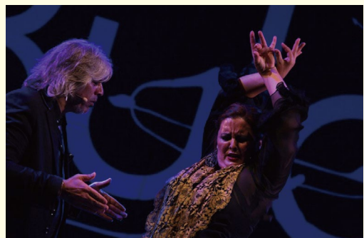
情熱的な女性フラメンコ歌手