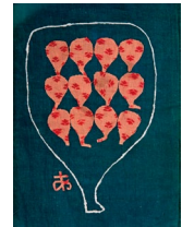
宮脇綾子《いちぢく》1986年