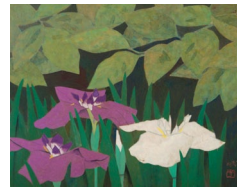
倉光博《柿若葉と菖蒲》1960年頃

※中学生以下及び各種障害者手帳提示者は無料 ※( )内は20名以上の団体料金 ※各種障害者手帳提示者の付添人は一般観覧者の半額