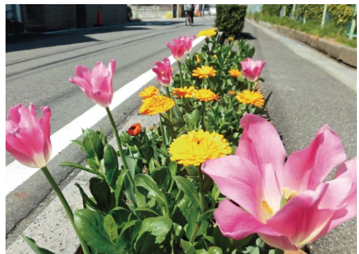
(西枇杷島小学校南側の歩道花壇[4月撮影])