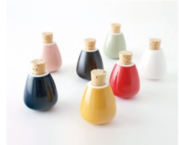
《swing spice case》

清須にゆかりのある作家を紹介するシリーズの第5弾となる本展では、当市に工房をもつセラミックデザイナーの岡崎達也(1976-)を取り上げます。彼の陶磁器は、愛らしい見た目だけではなく自身が感じた日常のちょっとした不便さや気づきをもとにデザインされています。わたしたちの生活にそっと溶け込み、日常に寄り添ってくれる彼のデザインの数々をお楽しみください。