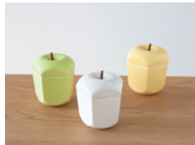
《pomme sugar pot》

イベント、ワークショップ多数あります！ 詳しくは公式ホームページをご覧ください！