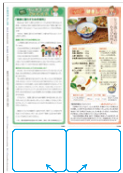
この場所に掲載します!

広報清須は、毎月1日に発行し、原則発行日から約3日間で配布されています。毎号、約30,000部作成し、市内のご家庭・事業所に各戸配布しているほか、市の施設等の広報スタンドにも置いています。また、市ホームページでも見ることができ、大きな宣伝効果が期待できます。ぜひ広告を掲載してみませんか?