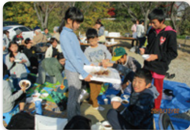
料理をふるまう様子

子どもたちはうなぎの掴み取りを、大人はうなぎや肉を焼き、子どもたちが収穫した宮重大根と、知多の海で釣った渡り蟹を使った味噌汁や人参ご飯の準備をしていました。中学・高校生の清須市ジュニアリーダーと子どもたちは、高齢者の方に準備した料理を振る舞い、皆さんとてもにぎやかに楽しまれていました。中には掴まえたうなぎを持ち帰り飼育する子どももいました。