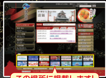
この場所に掲載します!