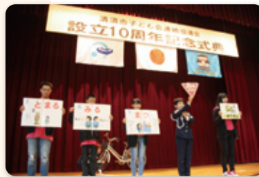
自転車の乗り方説明

るな人と話をすることや、思いやりの気持ちを持つことの大切さを学ぶ良い機会になったのではないのでしょうか。