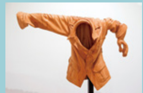
黒蔵社《存在しない俺》1984年