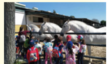
馬の群れを見学している児童たち

皆さんも、「Caballo Cartujano」について調べてみると面白いと思います。