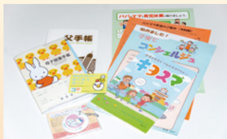
妊娠届出時お渡し資料

母子健康手帳は、妊娠中のお母さんと赤ちゃんの様子、その後の子どもの成長を記録する大切なものです。