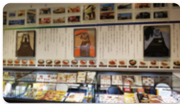
歴史と魅力が詰まった壹番屋記念館

西枇杷島町の第一号店が2014年にリニューアルした際には、「ココイチ」の歴史と魅力が詰まった資料館「壹番屋記念館」が