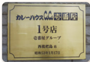
CoCo Ichiban 1号店のネームプレート

併設されました。記念館には創業時からのメニュー表や、食器や内装、制服の変遷が紹介され、懐かしい雰囲気も漂っています。人気キャラクターとコラボしたグッズ