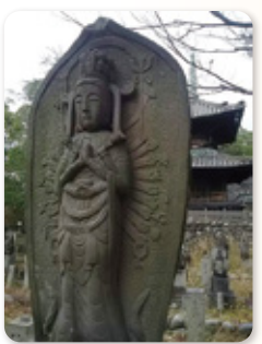
長谷院に並ぶ石仏

本堂脇には、宝珠とお多福が刻まれた開運石も。境内には神明社、長命龍神も祀られて、昔から人々の願いを受けとめてきた温もりも感じられます。