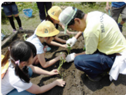
児童と一緒に苗植えを行う下小田井防犯協会の皆さん

学校は、地域の方々による子どもたちへの愛情ある活動によって守られており、この気持ちに感謝し、多くの地域でこのような活動が広がり、続いていくことを願っています。