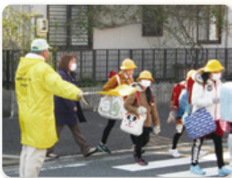
古城小学校児童の登下校を見守る下小田井防犯協会の皆さん

域本部」を立ちあげた時は、何から始めればいいのか、誰に何を頼んでいいのか、まったくわかりませんでした。そんな時、地域の防犯パトロールをしている「下小田井防犯協会」の皆さんにお会いしました。