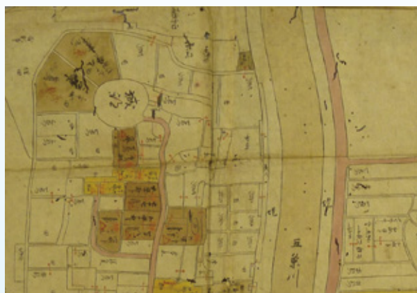
清洲田中町・田中町分絵図部分図 (清洲城跡付近)

今回の企画展において、本市で所蔵している江戸時代以降の村絵図・絵地図・地籍図等、絵図・地図資料を中心に展示します。