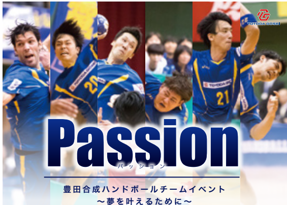
豊田合成ハンドボールチームイベント ～夢を叶えるために～

所在地：〒452-0961 清須市春日夢の森1番地 電話：052-400-1044 開館時間：午前10時～午後7時 休館日：3/6(月)・13(月)・21(火)・27(月)・31(金)