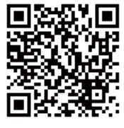
スマホ・携帯電話はこちらから

ナゴ(https://www.pref.aichi.jp/seishin-c/soudan_navi/index.html)もご利用ください。