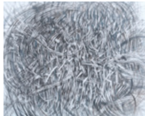
準大賞受賞作品 《My Diary》