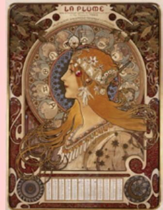
《黄道十二宮 ラ・プリュム誌のカレンダー》 1896年 OZAWA コレクション

本展では、アルフォンス・ミュシャによる商業デザインに焦点を当て、「ミュシャ・スタイル」と呼ばれる独自のモチーフ使用や画面構成、制作プロセスなどにも迫ります。