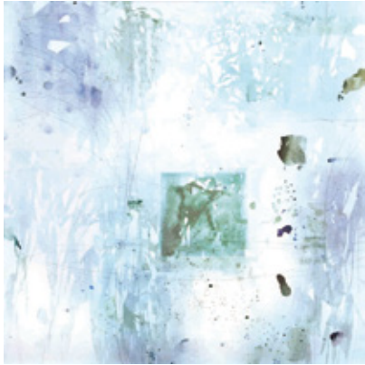
大賞受賞作品《光と希望》

市はるひ美術館では開館以来、新たな才能の発掘・育成を目指し、絵画の公募展を開催してきました。アーティストシリーズは、この公募展で高く評価された作家を個展形式で紹介する展覧会です。