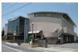
にしびさわやかプラザ