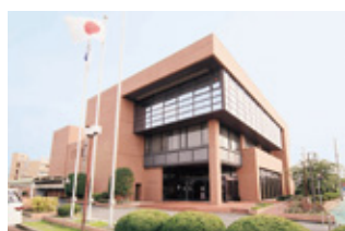
清洲市民センター