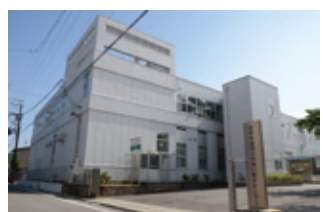
新川ふれあい防災センター