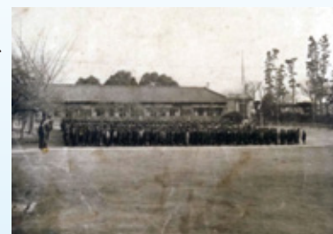
新川尋常高等小学校(昭和11年当時)