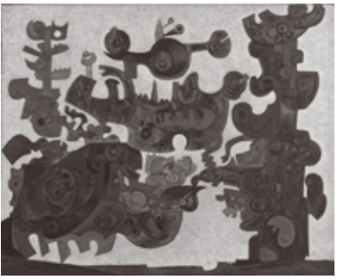
《尻尾のない機械》1953 年