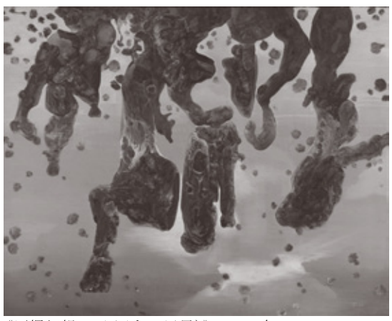
《原爆幻想 12 図 (ある風景)》1982 年