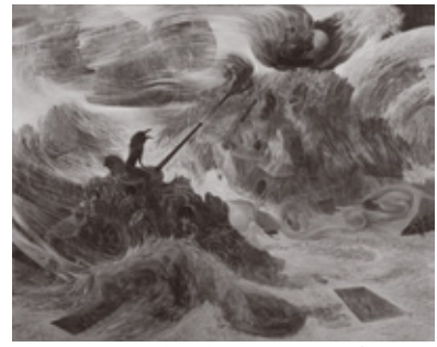
《戦禍図 10 の内 4 (砲撃)》1980 年