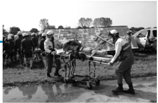
倒壊家屋、被災車両からの救出訓練