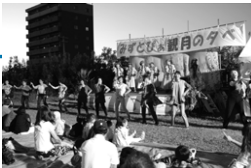
ステージの様子(フラダンス)

市民の皆さんらが主体となって始まったこの催しは、本年度3回目を迎え、観月屋台や文化ステージなどが行われ、会場は多くの人でにぎわいました。