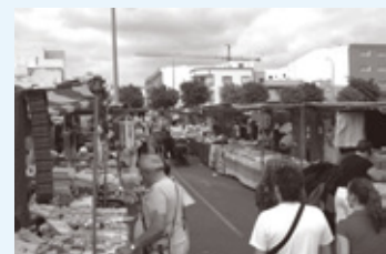
メルカディーヨの様子