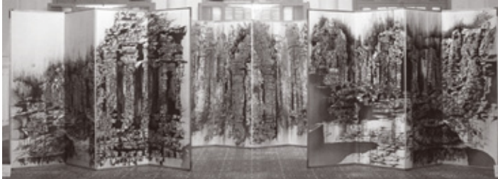
三部作《辿りついた場所》

市民割が お得です！ 市民割 200円 切り取ってお持ち ください。 鳥羽美花展