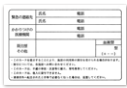
福祉カード見本 裏面