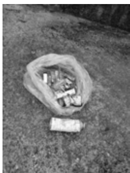
火災の原因となったカセットボンベとライター

この火災の原因は、調査の結果「ガスの残ったカセットボンベとライター」でした。本市では、こうした車両火災が起きないように、カセットボンベやスプレー缶等は、「発火性危険物」として資源の日に分けて回収しています。ごみや資源を出すときは、分別ルールを守って排出していただくようお願いいたします。