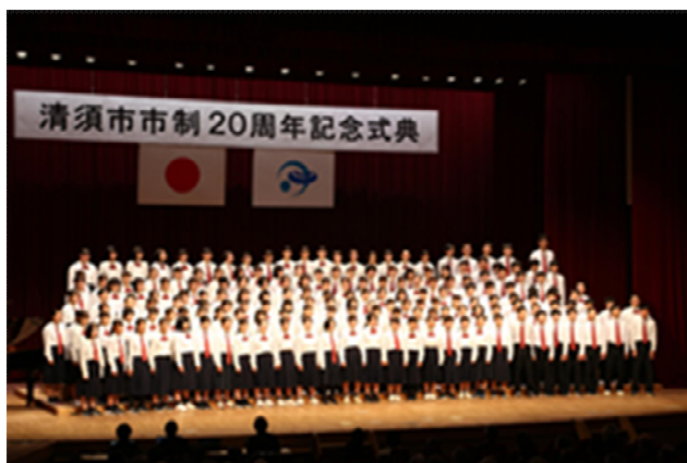
市制20周年記念式典での合唱隊

合唱はひとりでがんばる音楽ではありません。 隣の人をの声を聴きながら、自分の声を重ねていきます。 楽譜が読めなくても、大丈夫。 自分の声に自信がなくても、大丈夫。 みなさんと一緒に活動できることを楽しみにしています。