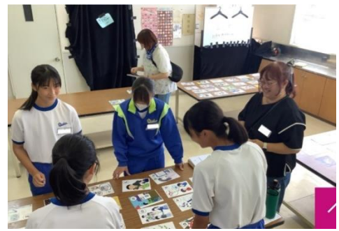
かるたブースのお手伝い

古城小学校と西枇杷島小学校では、毎年6年生が、読みを担当し、下級生の前で、「東海豪雨紙芝居」を演じています。