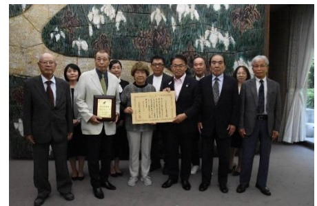
愛知県知事より表彰状と盾を授与されました。

「にしびわくわくサポーターズ」は、平成12(1999)年9月に甚大な被害をもたらした東海豪雨から15年経った平成27(2015)年に、東海豪雨を知らない世代も増えてきたことから、そうした世代に対し、シニア世代から東海豪雨の災害の様子を伝えることが、今後の防災教育の礎となり、将来の世代を含む誰もが安心して暮らせる社会をめざす第一歩となると考え、「にしびわくわくサポーターズ」を結成しました。オリジナル大型紙芝居「忘れない東海豪雨～語り継ごう未来のために～」の制作にあたり、紙芝居舞台を一から作り上げ、以来10年にわたり、地域の小学校で活動。また、平成30(2018)年より「にしびわくわくプラザ」(こども食堂)に携わり、毎年夏には、「流しそうめん」を企画運営し、三世代交流の場を提供している活動が認められ、今回の受賞となりました。