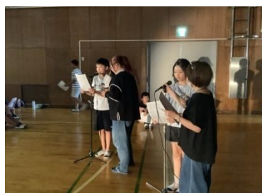
西枇杷島小での練習の様子