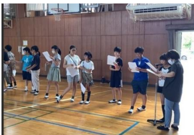
古城小での練習の様子

古城小学校と西枇杷島小学校では、毎年6年生が、読みを担当し、下級生の前で、「東海豪雨紙芝居」を演じています。