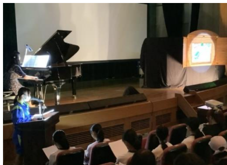
東海豪雨紙芝居の上演