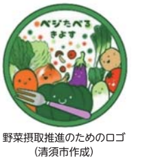
野菜摂取推進のためのロゴ (清須市作成)