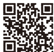
PC・スマートフォン用

徘徊等により、行方不明になった際に、家族等の依頼により、市内に設置されている同報無線を利用し検索するとともに、このシステムに登録して頂いた方へ行方不明になった方の身体的特徴や服装等の情報を配信します。