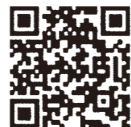
フィーチャーフォン (ガラケー)用